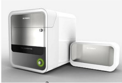
Cell 3 iMager Estier

近年、細胞イメージング分野は、解析装置の進歩に伴って著しい発展を遂げており、生物顕微鏡を使用した、より詳細な生物現象の解析が可能になってきています。生物顕微鏡は、高解像度で鮮明な画像を取得できる半面、視野が限定されることや、染色などの前処理を行うためサンプルに侵襲的な影響を与えることなどが課題となっています。